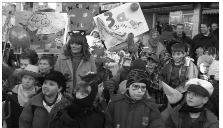
Prächtig verkleidet nahmen die Oeventroper Kinder am Schulumzug teil.